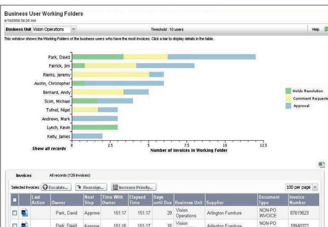
Operatività nei processi esterni ad AP

Per ulteriori informazioni visitare kofax.com .